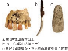
a: 歯(戸塚山古墳出土) b: 刀子(戸塚山古墳出土) c: 具斧(浦底遺跡・宮古島市教育委員会所蔵)

人類学や考古学を専門とする4名の研究者が、出土した遺物を手がかりに過去の人々の姿や文化に迫ります。