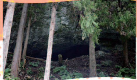
「アバクチ洞穴遺跡」 弥生時代の幼児骨が出土 岩手県花巻市

2023 1.5 木 - 2.26 日 9:00 - 16:45 (入館は16:15まで)