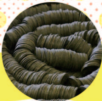
「八反遺跡」 まとまって出土した鏡 所蔵：(公財)山形県埋蔵文化財センター