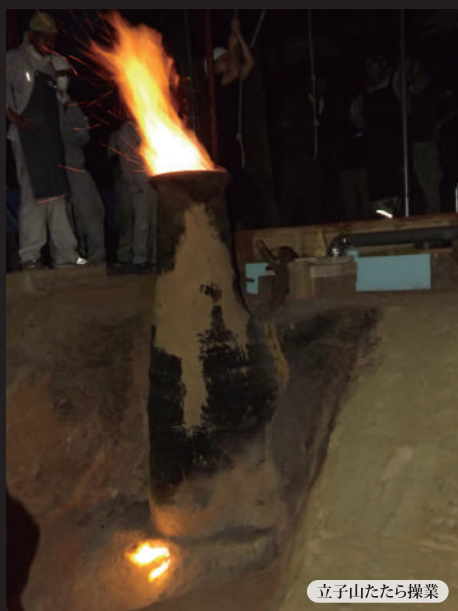
立子山たたら操業