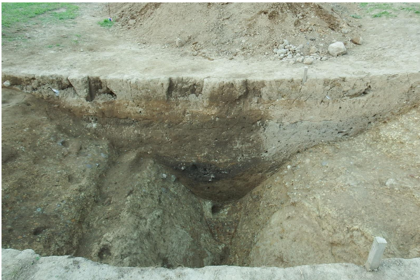
■ 今回の調査で確認できた外堀(深さ2m)