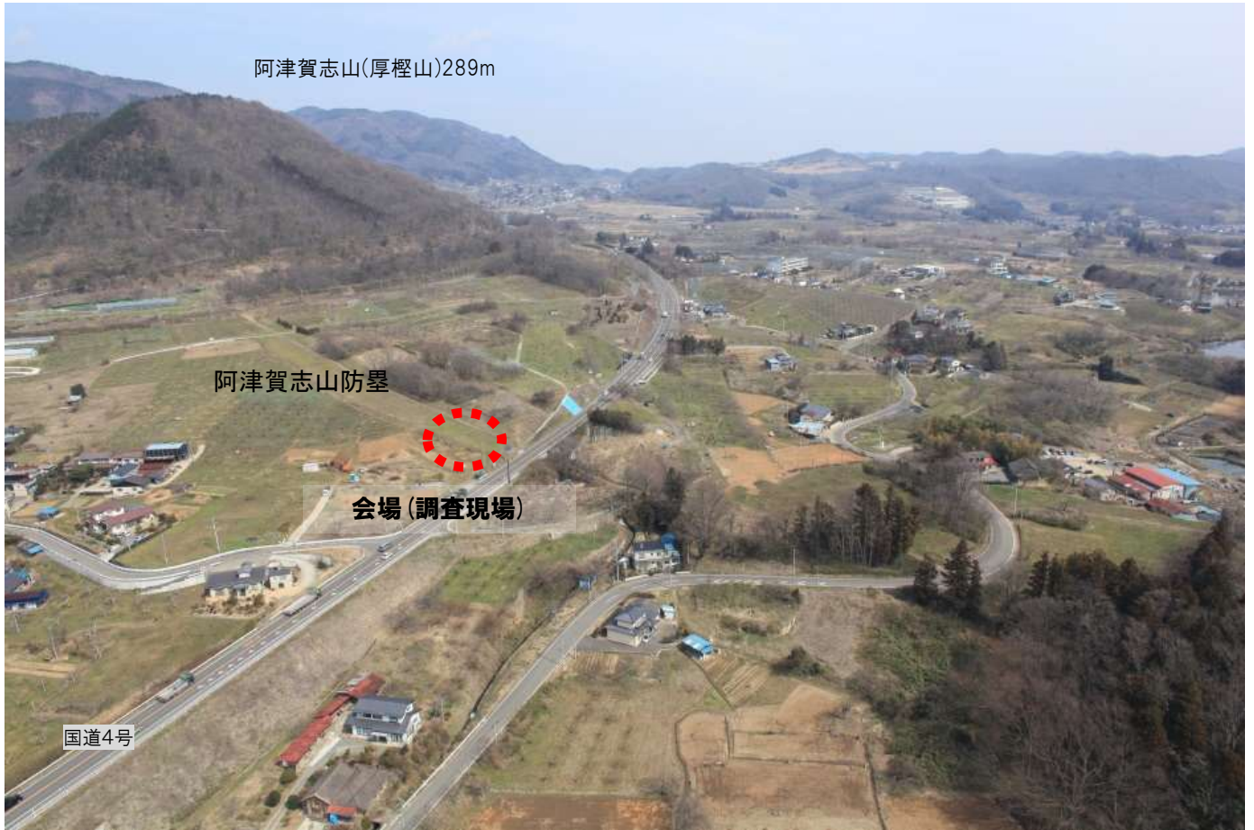
阿津賀志山防塁第16次調査 調査地点