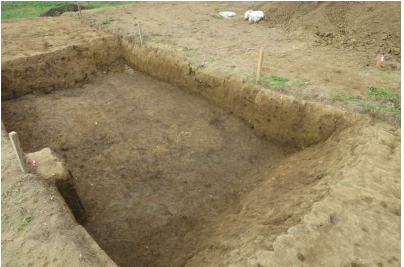
今回確認された外堀(※未完掘 10/23 現在)