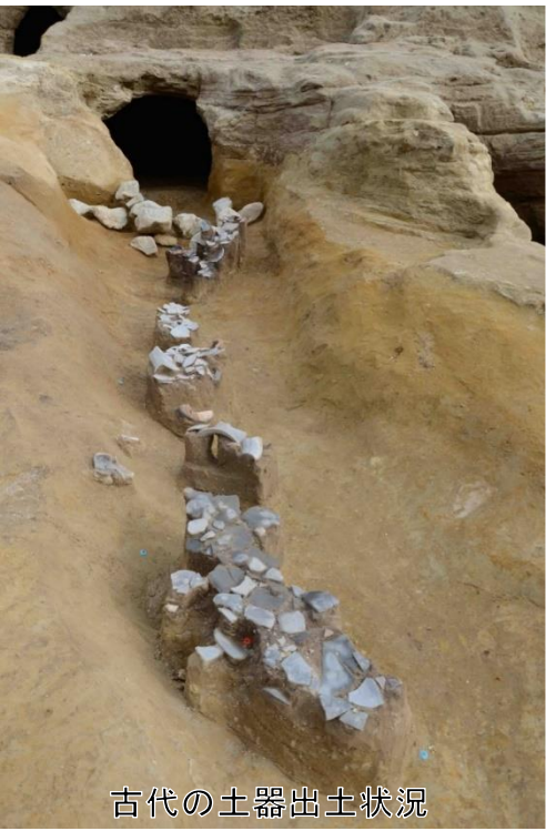
古代の土器出土状況