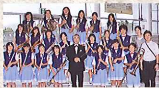
野田小学校合奏団

「いわてブラスアンサンブル」は、岩手県在住の金管四重奏アンサンブルです。サクソフォーン、ホルン、トロンボーン、チューバによる迫力あるサウンドと、メンバーの楽しいお話で音楽を身近に感じて頂ける公演を目指しています。