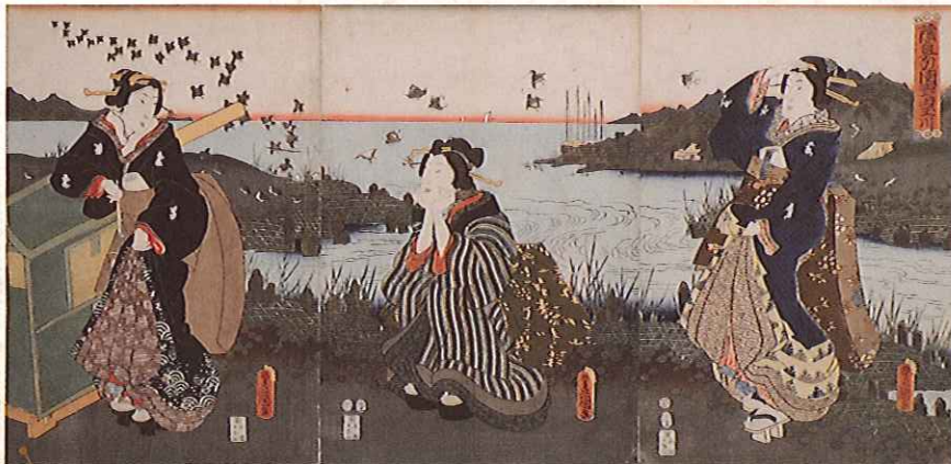
【歴史】錦絵「陸奥の国野田玉川」/三代歌川豊国画