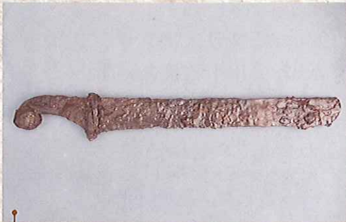
【考古】蔵手刀(野田村中新山遺跡) 農作業中、偶然発見されました。約1,250年前の刀です。

岩手県立博物館の地質・考古・歴史・民俗・生物の5部門から、野田村及び周辺地域に関する貴重な収蔵資料を公開します。 岩手そして野田村が誇る美しい自然、歴史ある文化の一端に触れる機会を創出いたします。