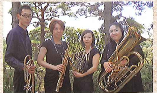
いわてブラスアンサンブル