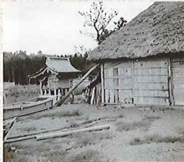
【民俗】野田村米田海岸にて撮影 昭和37年撮影