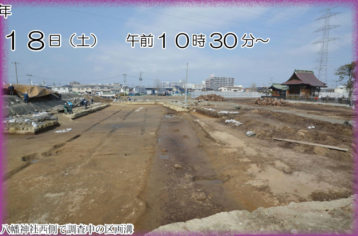
八幡神社西側で調査中の区画溝